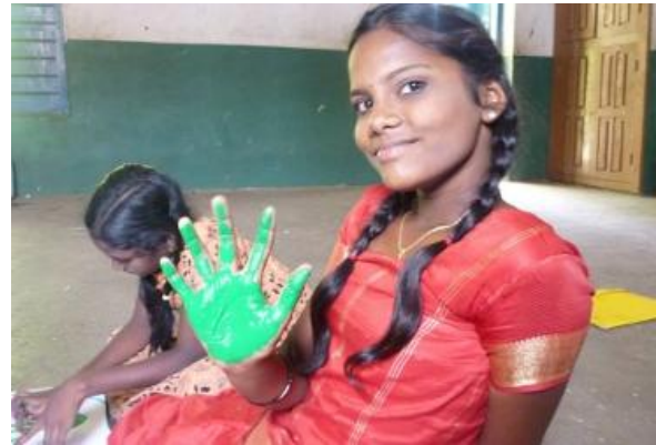
Spiel und Spaß beim Ferienprogramm im Mai.