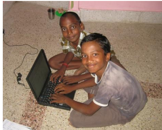
Schüler beim Computerunterricht.

Wir brauchen mal wieder Laptop-Nachschub für unsere Computerkurse in Shenbakkam. Daher unsere Bitte: Wer einen funktionstüchtigen Laptop ausrangiert und unserem Projekt spenden möchte, der möge sich bitte bei uns melden ( flath.herbert@gyan.shenbakkam.de ). Wir löschen sämtliche Daten, führen einen Funktionstest durch und schicken die Geräte dann nach Shenbakkam, wo noch ein englischsprachiges Betriebssystem aufgespielt wird. Die Laptops werden dann in unseren Computerklassen eingesetzt.